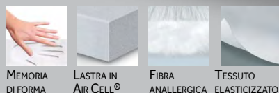
MEMORIA DI FORMA LASTRA IN AIR CELL® FIBRA ANALLERGICA TESSUTO ELASTICIZZATO