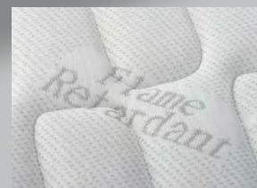
PARTICOLARE DEL TESSUTO DI RIVESTIMENTO DEI PANNELLI CON LOSANGATURA A TUTTO CAMPO